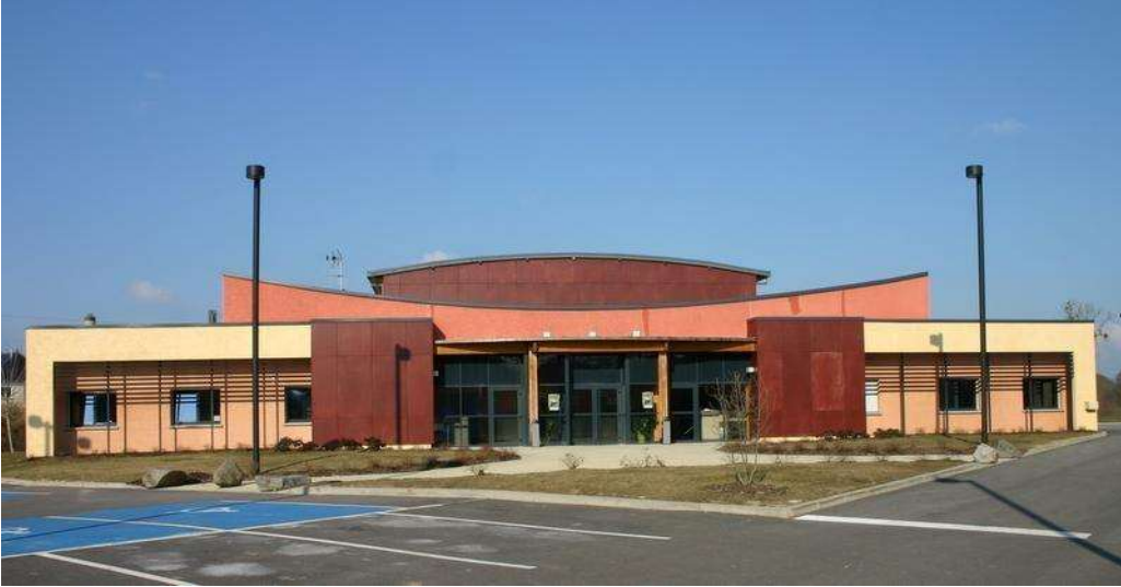
Consigne pour la salle : « il est interdit de clouer, agraffer ou coller sur les murs ». Merci.